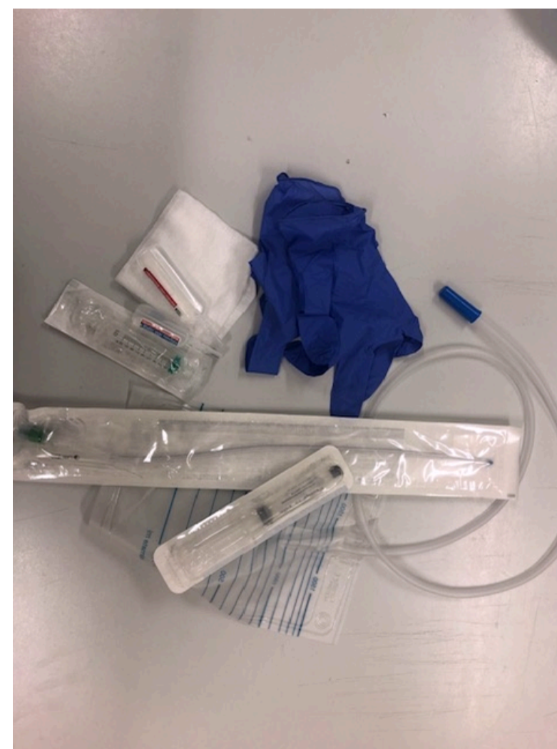
Afbeelding: schone, niet steriele materialen

Bekijk de instructievideo's voor de nieuwe manier van werken; eenmalige katheter vrouw en man , en verblijfskatheter vrouw en man .