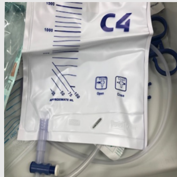
Afbeelding 3: Kraantje-opvangzak