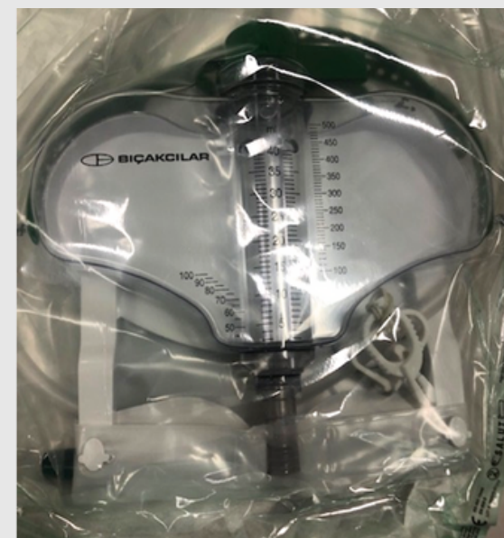
Afbeelding 2: Urimeter