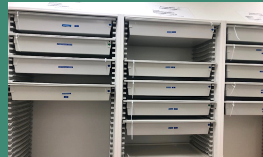
Afbeelding 4: Procedurebakken

Er wordt gewerkt met procedurebakken waarin alle benodigde materialen aanwezig zijn (blaaskatheter, epiduraal, spinaal, CVL).