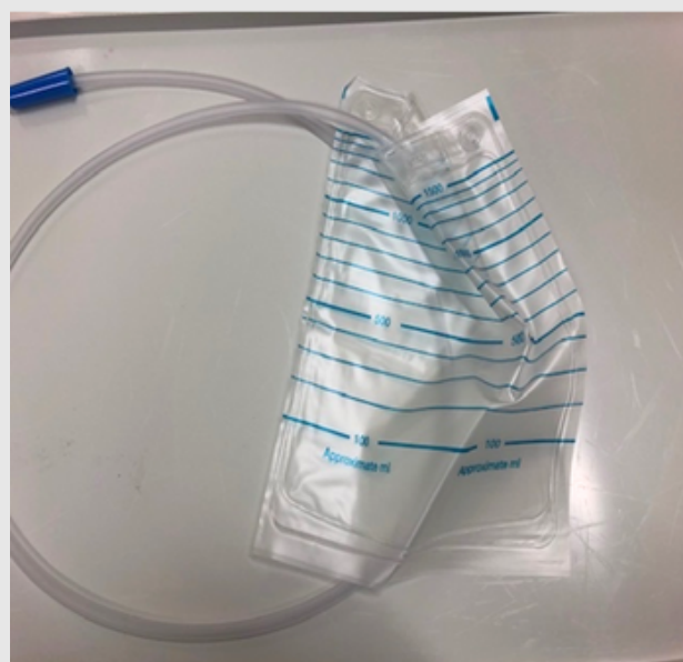
Afbeelding 1: Gesloten opvangzak

Afhankelijk van type ingreep pas je de opvangzak aan: